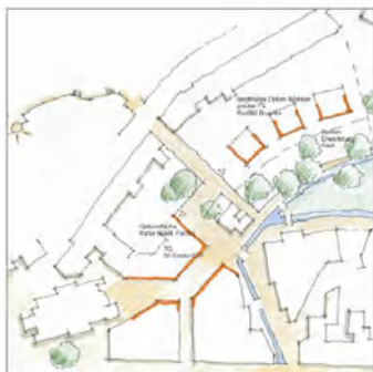
Alternative Studie Fronhof