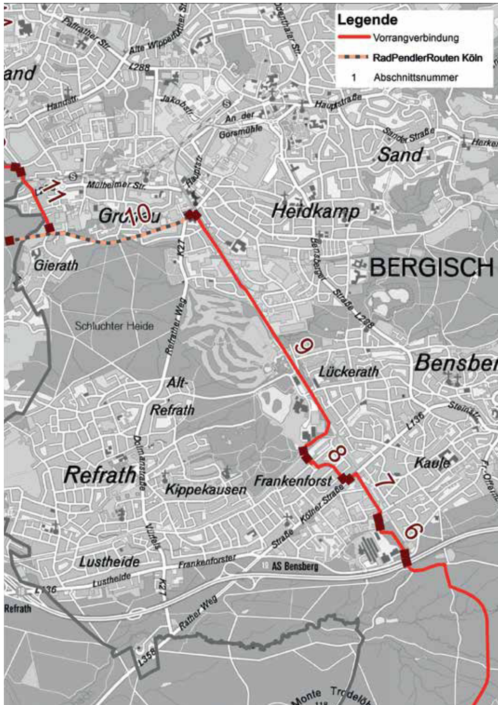
Quelle: eigene Darstellung, Karte: Geodatenmanagement Rheinisch-Bergischer Kreis