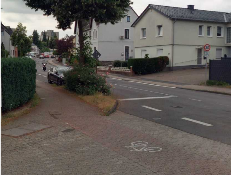
Bild: Sichtbeziehung an der Schmidt-Blegge-Straße

Im Ausschuss für Anregungen und Beschwerden wurde unter der Drucksachennummer 0160/2026 die „Verkehrssituation an der Einmündung Schmidt-Blegge-Straße/Dellbrücker Straße“ beraten und an den AMV verwiesen. Hier liege eine unzureichende Sichtbeziehung von der Schmidt-Blegge-Straße links einbiegend in die Dellbrücker Straße vor.