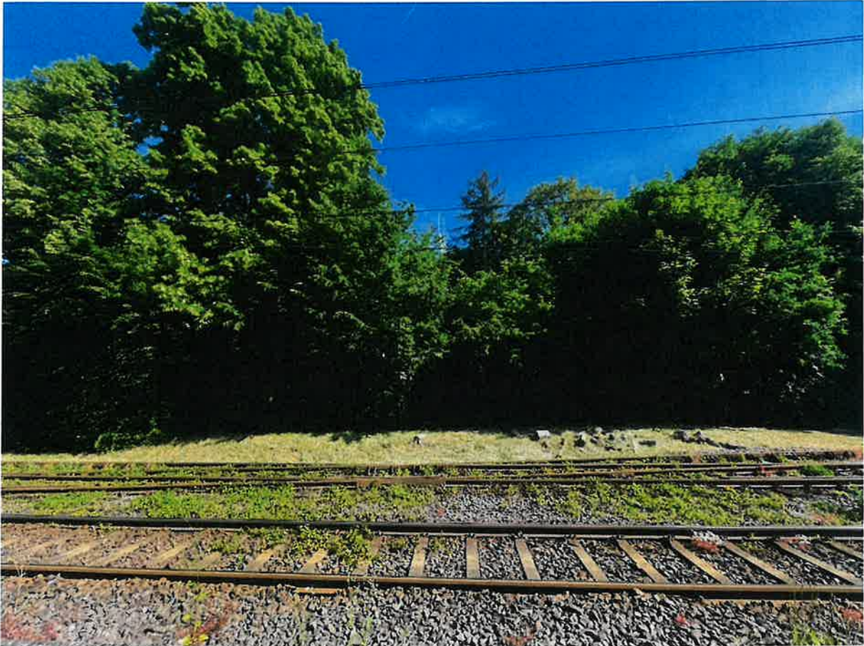
Abbildung 2: Blick aus südlicher Richtung auf die geplante Eingriffsfläche

Gemäß der aktuellen Planung soll das künftige Bahnstromunterwerk genau an der Stelle errichtet werden, an der die größten und aus umweltschutzfachlicher Sicht besonders schützenswerten alten Bäume (Linden) (vgl. Abb. 1 und Abb. 2) im Plangebiet stehen. Gerade mittelalte und alte Bäume sind an den jeweils vorhandenen Standort aber bereits gut angepasst, erfüllen einen vielfach höheren Nutzen für die Biodiversität und speichern in gleicher Zeit deutlich mehr CO 2 als Jungbäume. Daher sollten alte Bäume - wann immer möglich - erhalten werden. In der artenschutzrechtlichen Prüfung der Stufe 1 wird zudem festgestellt, dass nicht auszuschließen ist, dass im Plangebiet baumgebundene Fledermausarten vorkommen. Eben diese Artengruppe ist auf Altbäume mit Rindenabspaltungen, Hohlräumen etc. angewiesen. Daher sollte angestrebt werden, das Bauwerk, zur Schonung des Altbaumbestandes, möglichst in einem Bereich ohne Altbaumbestand zu errichten, da das Schutzziel sehr hoch zu bewerten ist (vgl. Abb. 3).