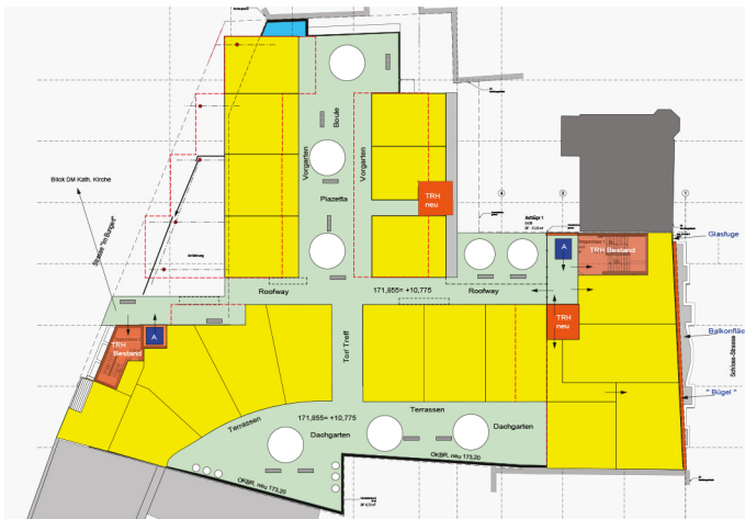
3. Obergeschoss ehem. Parkebene 3 +10,775 BGF Nutzungen 1.468 m 2 19 WE