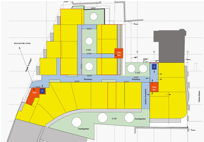
4. Obergeschoss ehem. Parkebene 4 +13,775 BGF Nutzungen 1.567 m 2 21 WE