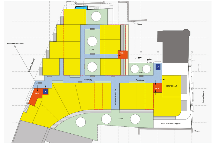
5. Obergeschoss als neues Geschoss + 16,775 BGF Nutzungen 1.433 m 2 19 WE