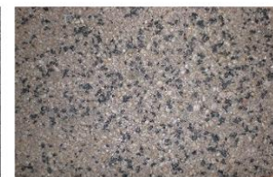
Natursand mit Basalt

Zusätzlich wäre auch bei Asphalt der Einsatz von Prägetechnik möglich, mit der eine Pflasteroptik erreicht werden kann. Vergleichbare Flächen wurden u.a. schon vor vielen Jahren bei Querungsstellen in Refrath (Siebenmorgen und Kippekausen) umgesetzt und haben sich bis heute bewährt.