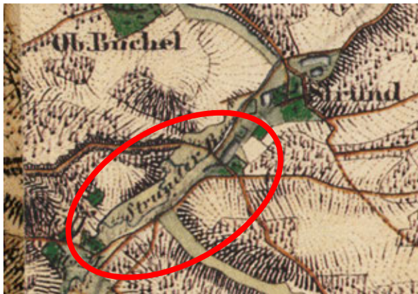
Quelle: Preuß. Uraufnahme 1844