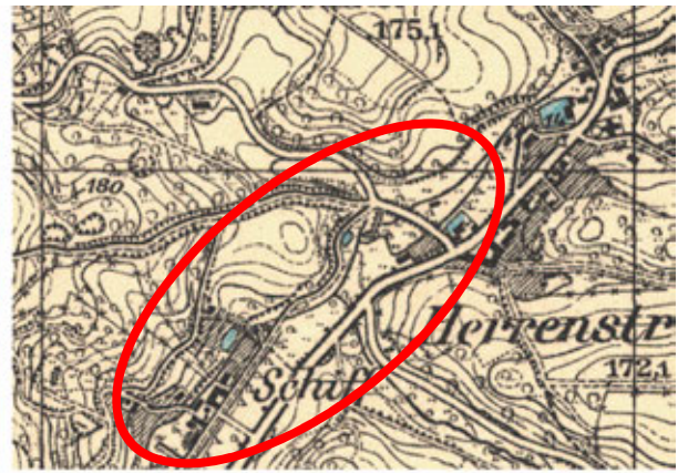
Quelle: TK25, 1935