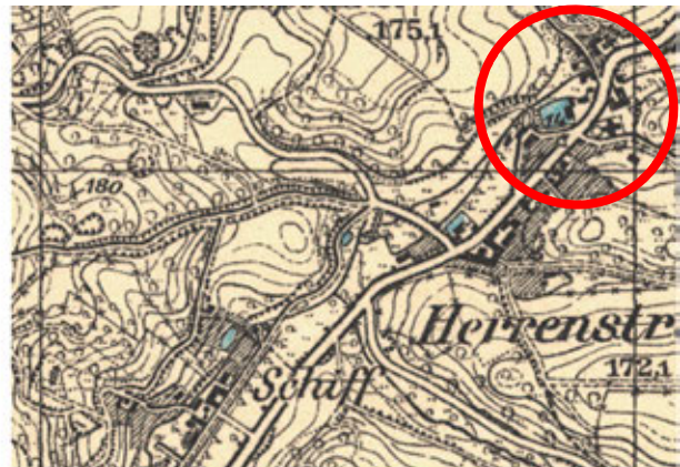
Quelle: TK25, 1935