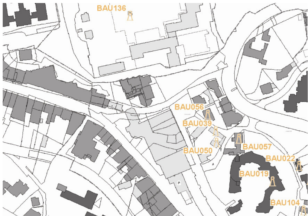
Baudenkmäler im Umfeld des Plangebietes