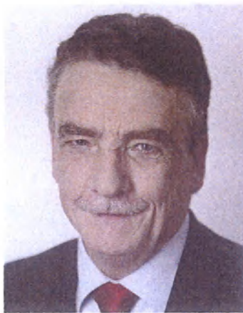
Minister für Bauen, Wohnen, Stadtentwicklung und Verkehr des Landes Nordrhein-Westfalen

Minister Michael Groschek: „Nur mit Ihrer Hilfe können intelligente Lösungen realisiert werden.“